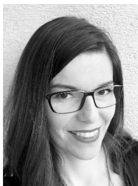
『リトル・ハーバー』 カタリーナ・クルナーチョ ヴァー(プロデューサー)