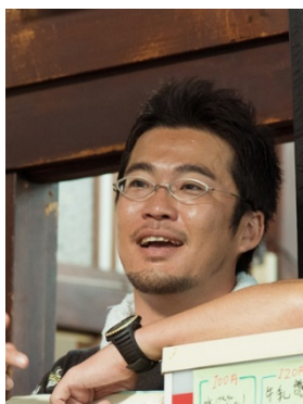
『チチを撮りに』 中野量太監督