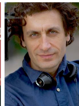
『殺し屋狂騒曲』 レヴオン・ミナスィアン監督