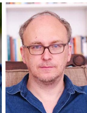
『ホワイト・サン』 デイヴィッド・バーカー (共同脚本、編集)