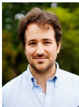
『喪が明ける日に』 アサフ・ポロンスキー監督