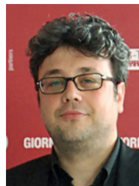
『父の足あと』 マルコ・セガート監督